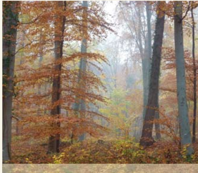
90 Jahre alter Baumbestand im Naturfriedhof Mühlthal

Welche Form der Bestattung ist auf dem Naturfriedhof Mühlthal möglich?