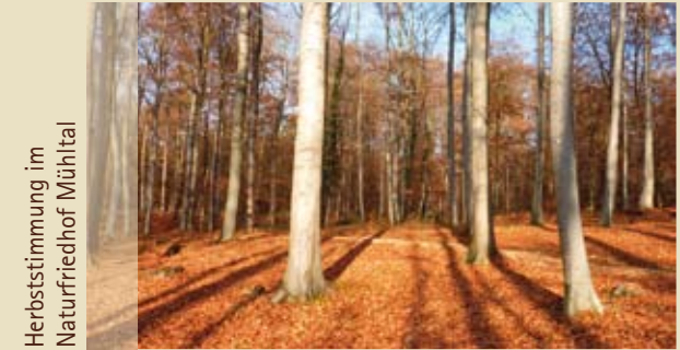
Herbststimmung im Naturfriedhof Mühlta

Im Wald findet der Körper Ruhe und die Seele Frieden.